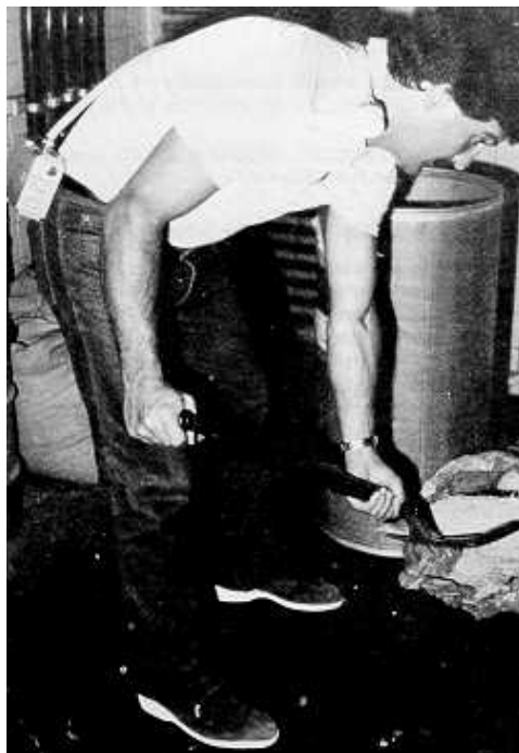
Fig. 3: Toma de muestra con cassette abierto

Mantener las precauciones anteriores mientras dure el almacenamiento de las muestras, hasta el momento de su análisis.